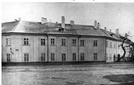
Zdroj: Archív UK v Bratislave: Zbierka fotografií – interiéry LF UK v Bratislave, okolo roku 1920

Obrázok 4. Aspremontov letný palác sa stal sídlom dekanátu LF UK hneď od jej vzniku. Pohľad z dnešného Amerického námestia z obdobia vzniku Lekárskej fakulty v Bratislave